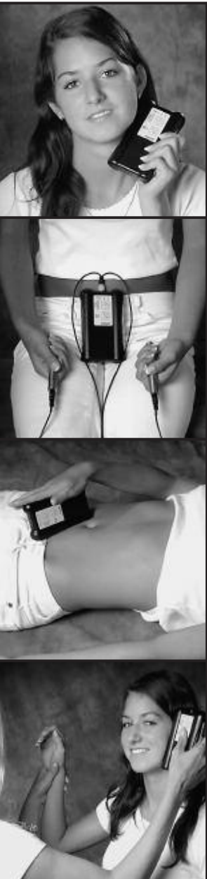
Anwendungsbeispiele für den Power QuickZap.