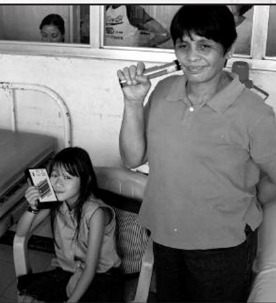
Eine Mutter und ihr Kind therapieren sich in einem Krankenhaus von Manila selbst.