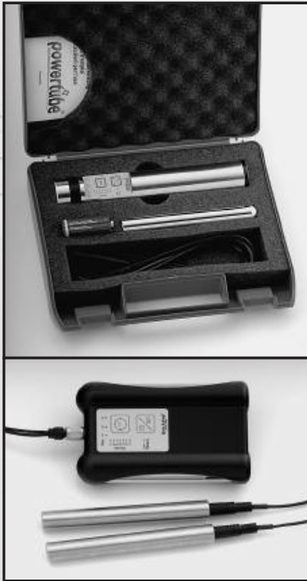
Die vergoldete Power Tube (oben) wird wie der Power QuickZap (unten) in einem robusten Kofferchen geliefert.

von wenigen Tagen eine spürbare Besserung zu verzeichnen.“